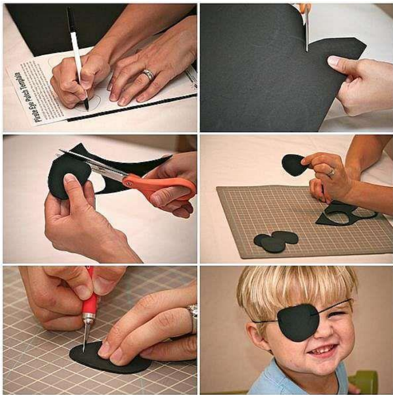
Приложение 2. Аксессуары для глаз